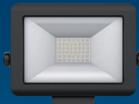
theLeda B30L BK