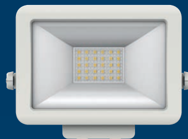
theLeda B20L WH

Das robuste, pulverbeschichtete Gehäuse, die hochwertige Linse aus Polycarbonat sowie die Schutzklasse IP 65 gewährleisten einen zuverlässigen Betrieb im Außenbereich.